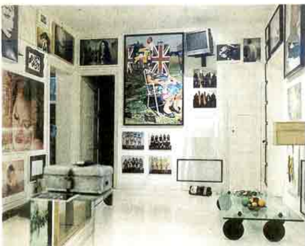
Bilder, wohin man schaut: Schon das Entree ist eine Kunstgalerie

Von Sengers Räume bilden ein Gesamtkunstwerk. Oder eben eine Galerie, in der man wohnen kann.