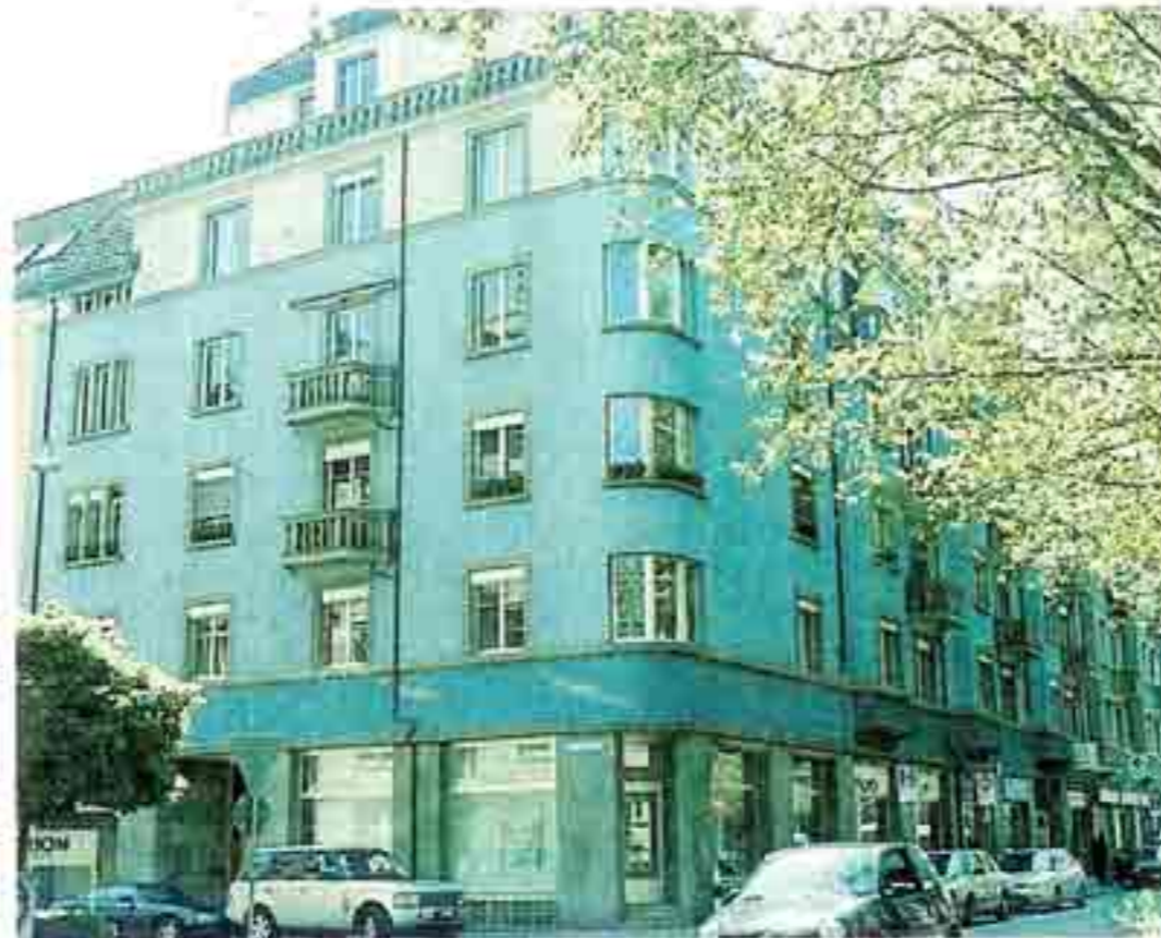
3./, Zimmer im Altbau: Das Haus im Zürcher Enge-Quartier