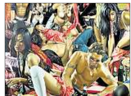
Und keiner amüsiert sich...

Galerie Nicola von Senger, Limmatstrasse 275, Zürich. Bis 19. Juli.