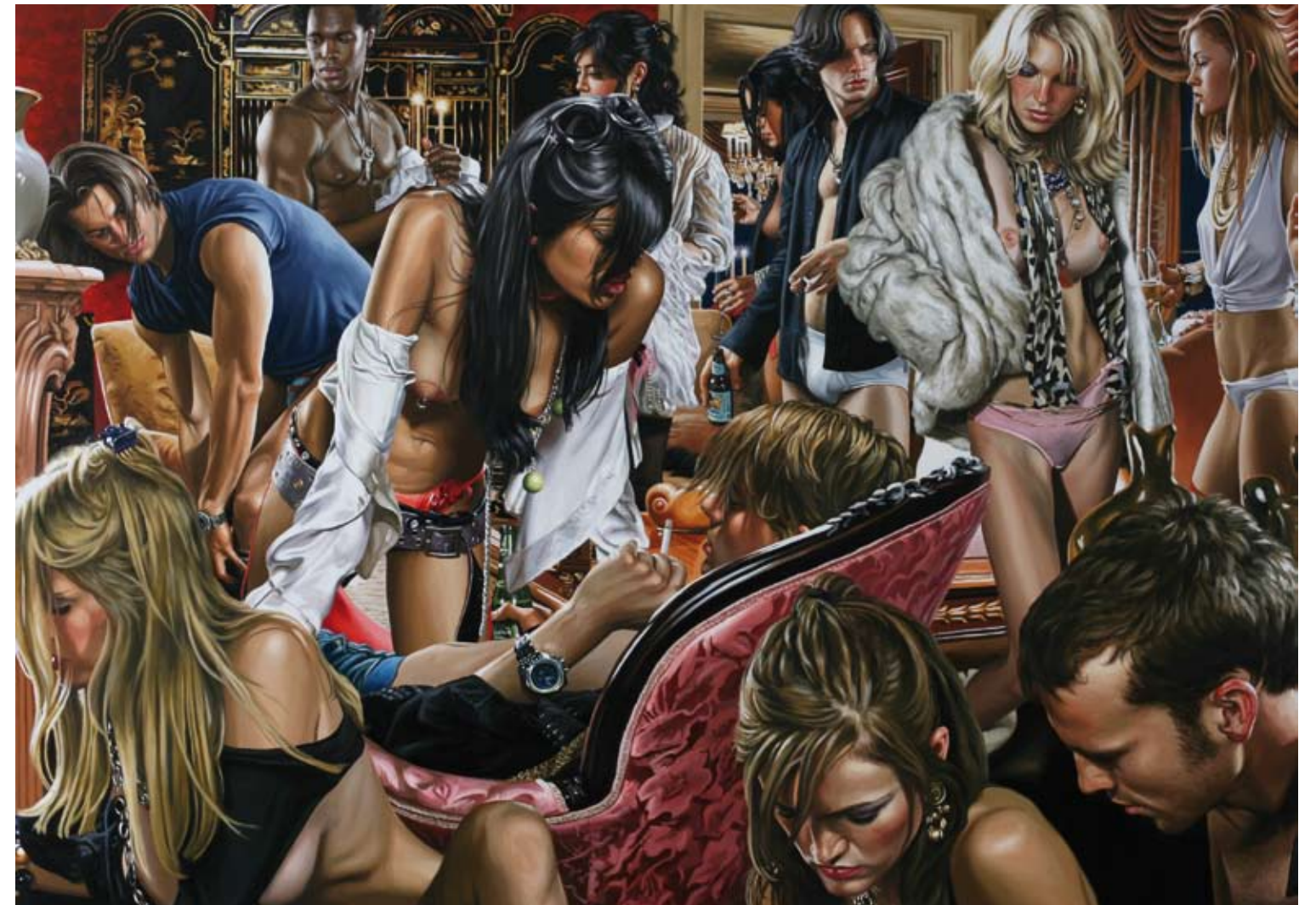
▲ The Rhythms of Infinite Grace 2007 196cm x 274cm, oil on linen.

Terry est un « ultra ». Il possède un coup de pinceau brûlant et un œil de marbre froid. Il est Ultra tout, ultra-lourd, ultra-clinquant, ultra-libertaire... Ultra fin. La perfection de chaque toile lui permet de mieux sublimer les dysfonctionnements d'une société en pleine débauche. La forme distance le fond. En s'appuyant sur des univers photographiques ultrachargés, son travail présente une vraie réécriture des grandes toiles narratives. Il juxtapose la perfection d'un traité pictural à une critique des temps modernes basées sur l'hédonisme, le matérialisme et l'insoutenable légèreté de l'être. Des poses figées telles des statues de cire, des comportements non assumés, des regards fuyants comme ceux de gamins coupables devant le jugement Saint.