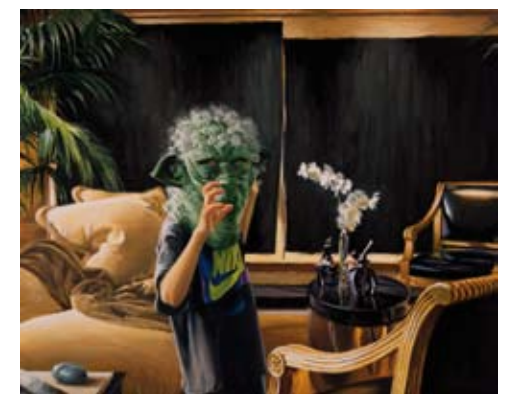
▲ Sammy 1997, 137cm x 170cm, oil on canvas.