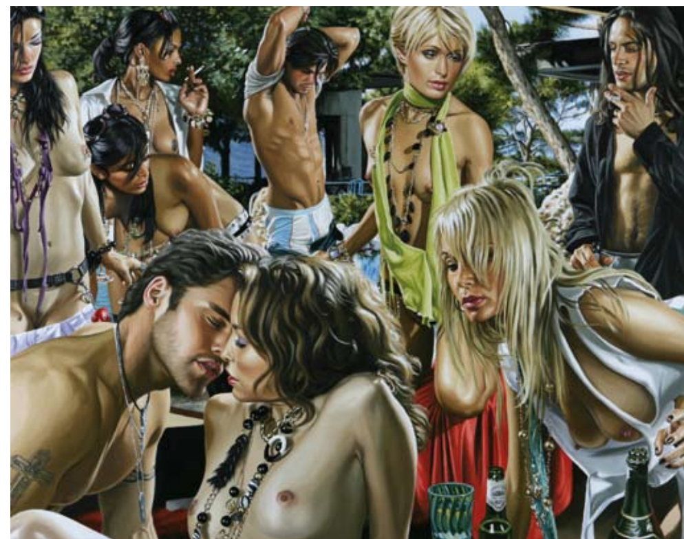
▼ The Retreat of Logic 2008, 142cm x 183cm, oil on linen.

C'est toujours le monde dans lequel nous vivons. Magnifique, troublant, indifférent, infiniment engagé et tout ce que nous possédons.