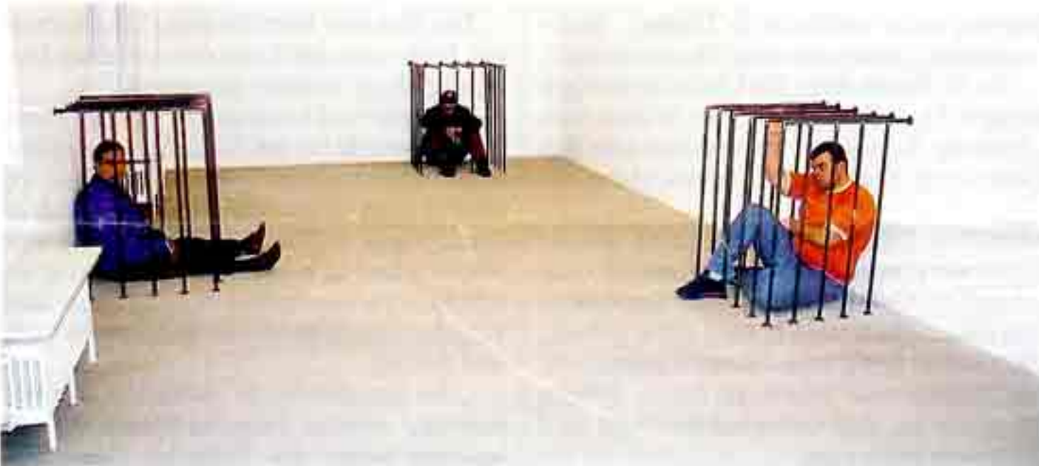
Motti-Aktion „Turn over“ (2003): Parodie auf die Polit-Kunst der Sechziger