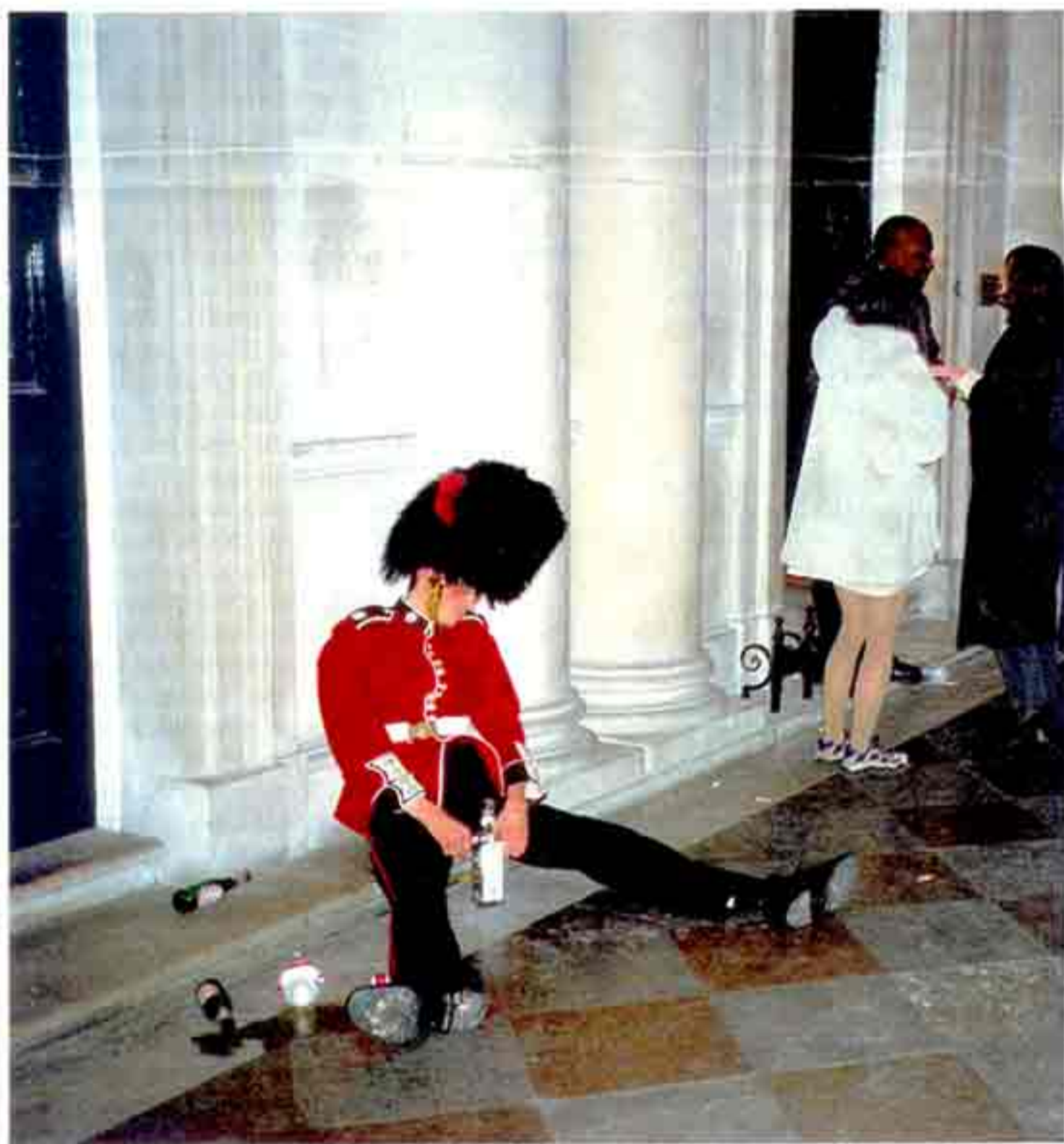
Motti-Aktion „Queen's Golden Jubilee“ (2001): Blamage fürs Königreich

Schon jetzt sucht Motti, 47, nach einem geeigneten Kandidaten. Sollte er keinen finden, werde er einfach seinen Schweizer Galeristen verpflichten – der wirke auch wie ein Banker und sei daher eine Idealbesetzung. Überhaupt seien sich Kunstmarkt und Börsenhandel sehr ähnlich, „alle sprechen vom Geld, für welche Summe man gerade die Aktien oder den Picasso ge- oder verkauft hat“, sagt Motti.