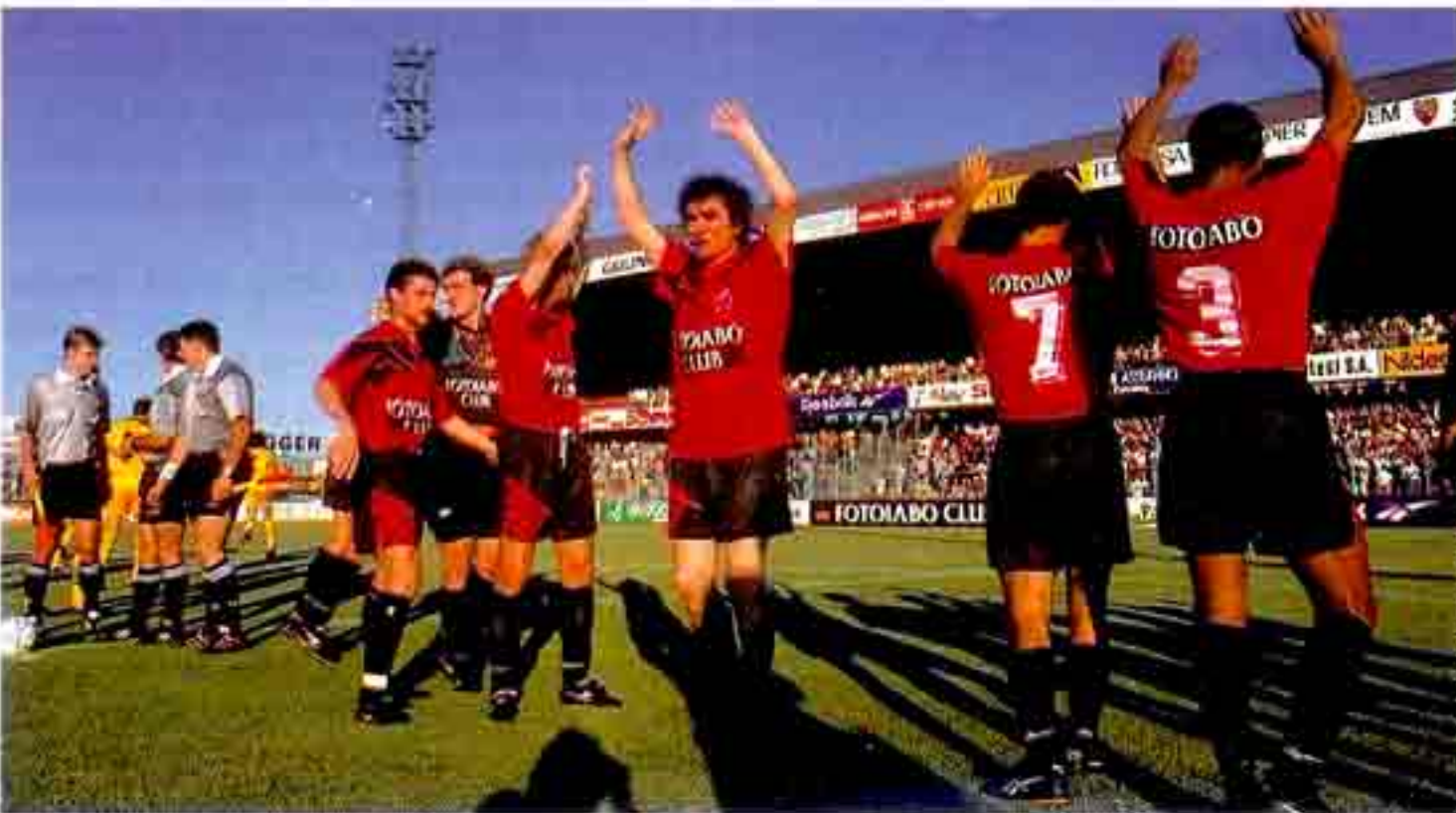
Motti-Auftritt in Neuchâtel (1995): Klamauk einer weltweit tätigen Nervensäge