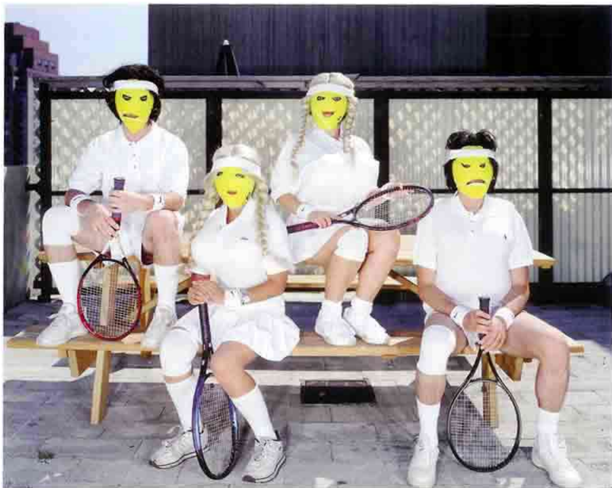
OLAF BREUNING, DOUBLE, 2003, C-print, laminated and mounted on aluminum, 56\frac{11}{16} \times 70\frac{7}{8} ", 48 \times 61 ", and 31\frac{1}{2} \times 39\frac{3}{8} " / C-Print, laminiert, auf Aluminium aufgezogen, 144 \times 180 cm, 122 \times 155 cm und 80 \times 100 cm.

Man erwartet eine Beschreibung des Jenseits, einen Einfall des Künstlers zur Welt des Unsichtbaren, eine Reflexion über die Oberflächlichkeit der Dinge, oder sogar einen Blondinenwitz. Auf alles ist man gefasst, nur nicht auf dieses It is something strange, so strange . Die Puppe insistiert, wie man es selbst auch tun würde, hätte man die Gelegenheit, sich mit einem lebendigen Toten zu unterhalten: Are you sad that your life is over? [...] Is life really about changing something? (Bist du traurig, dass dein Leben zu Ende ist? (...) Geht es im Leben wirklich darum, etwas zu bewirken?) Anstelle einer Antwort summt das Skelett ein Lied (=Hello Darkness=), das in den Worten gipfelt: See? It is always the same story (Siehst du? Es ist immer dieselbe Geschichte).