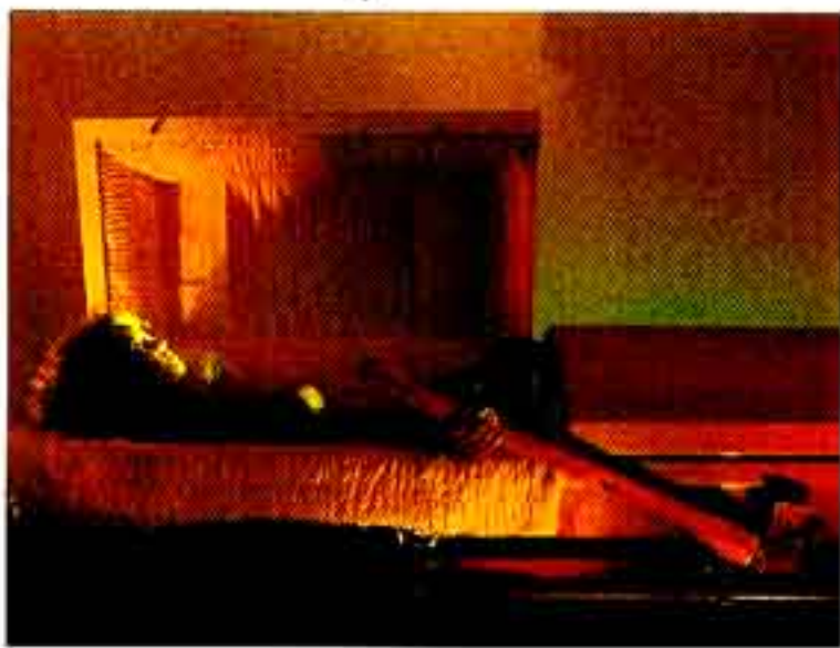
OLAF BREUNING, VAMPIRES, 2002, C-print, laminated and mounted on aluminum, 48 x 61" and 31 1/2 x 39 3/8" / C-Print, laminiert, auf Aluminium aufgezogen, 122 x 155 cm und 80 x 100 cm.