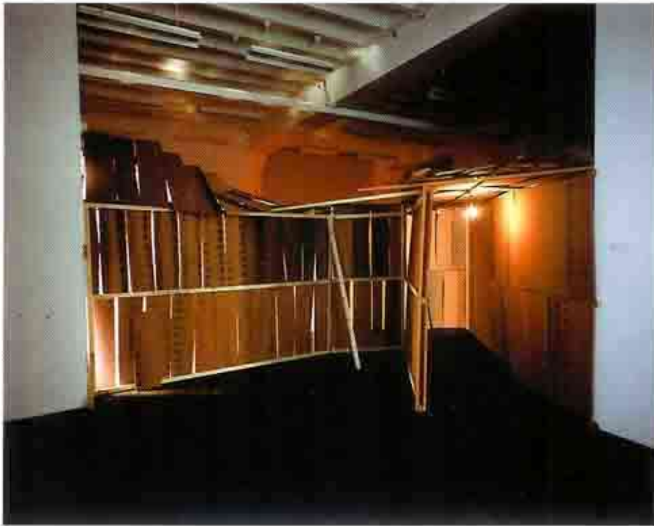
OLAF BREUNING, WOODWORLD, 1998, Installation view, Centre d'art contemporain, Genève.

einen Tunnel aus Brettern. Der Boden war mit Holzschnitzeln bedeckt. Durch die Bretterspalten sah man Lichter blinken. Manchmal mischte sich ein Donnerrollen ins allgemeine Gedröhn des Windes und der laufenden Maschinen. Die Besucher irrten also durch einen geschlossenen, dunklen Raum, etwas zwischen Schützengraben und Minenschacht, in einer Atmosphäre, die einem David Lynch zur Ehre gereicht hätte. Am Ende des Parcours wurde eine Videoprojektion gezeigt: eine feste Einstellung auf ein Auto, gewürzt mit diversen visuellen Effekten (Kunstschnee, Seifenblasen, Rauch, Lichtstrahlen) und einer Musik, die eine Kreuzung aus Rap, Techno und Disco-Pop war. «Was zu viel ist, ist zu viel», dachte man unweigerlich. Dieser Cocktail aus Geisterzug, Achterbahn, Weihnachtsdekoration und B-Movie-Kulisse war absolut unverdaulich. Doch es blieb ein Zweifel. Vielleicht hatte man etwas übersehen? Man kehrte an den Ausgangspunkt zurück, um sich das Ganze nochmals anzuschauen. Dabei tat sich eine andere Welt auf und der Wunsch in eine Geschichte hineingezogen zu werden – ganz gleich welcher Art und wäre sie noch so pathetisch – war stärker als jedes Urteilsvermögen.