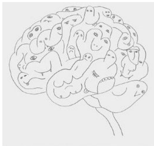
Hirnwindungen aus lauter Fabelwesen. (Bild: Olaf Breuning)