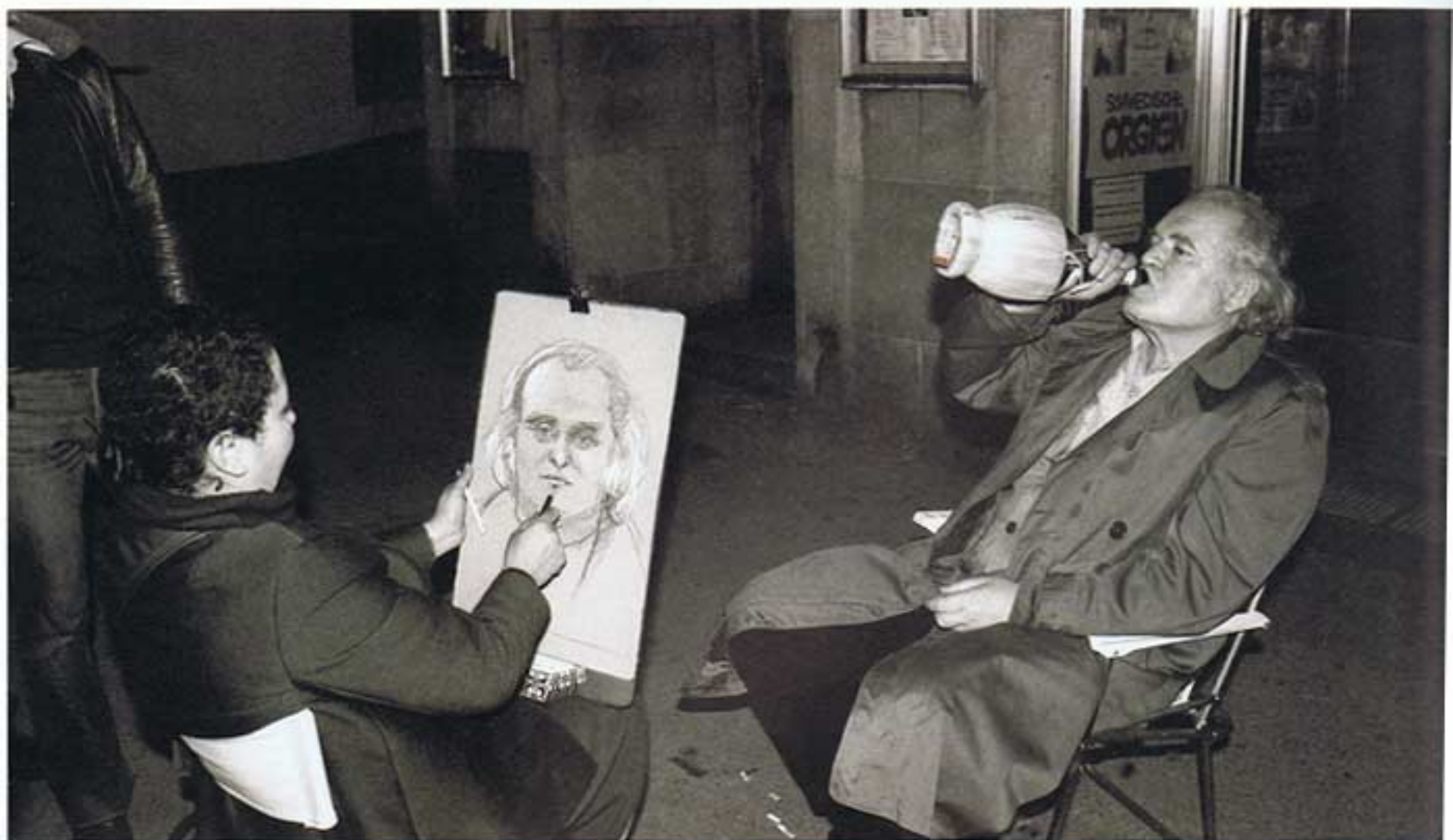
Mario Merz, Zürich Marktgasse, vor dem Kino Etoile.